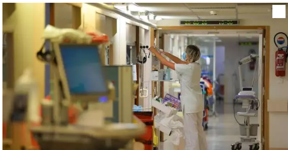
Le service de réanimation du CHU de Nantes avec des patients atteints de Covid-19.