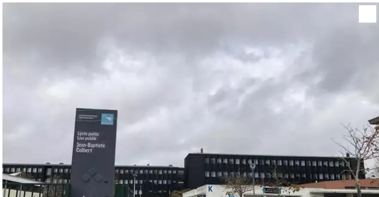
Le lycée Colbert à Lorient lui a proposé de l'héberger le temps nécessaire.