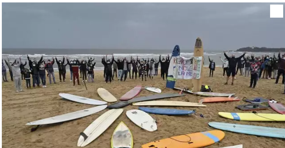
Lors d'un précédent rassemblement à Guidel, au joli slogan : Rendez-nous la mer.

Le collectif@Rendez-nous la mer du pays lorientais, qui a regroupé jusqu'à 400 usagers de la mer, se satisfait de la réouverture de la pratique des sports nautiques. Néanmoins, il maintient le rendez-vous de dimanche 29 novembre 2020, à Fort-Bloqué, afin de montrer à quel point la pratique sportive est essentielle à la santé