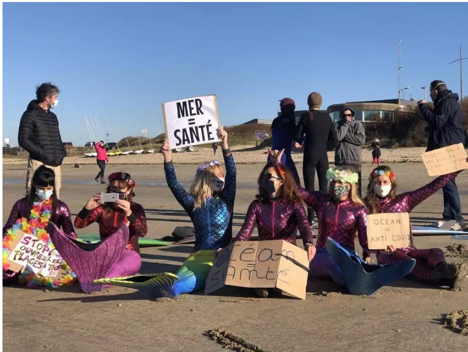
La mer, c'est la santé, scandent les surfeuses habillées en sirène pour ce rassemblement organisé à Fort-Bloqué, à Plœumeur (Morbihan), ce dimanche 29 novembre 2020.