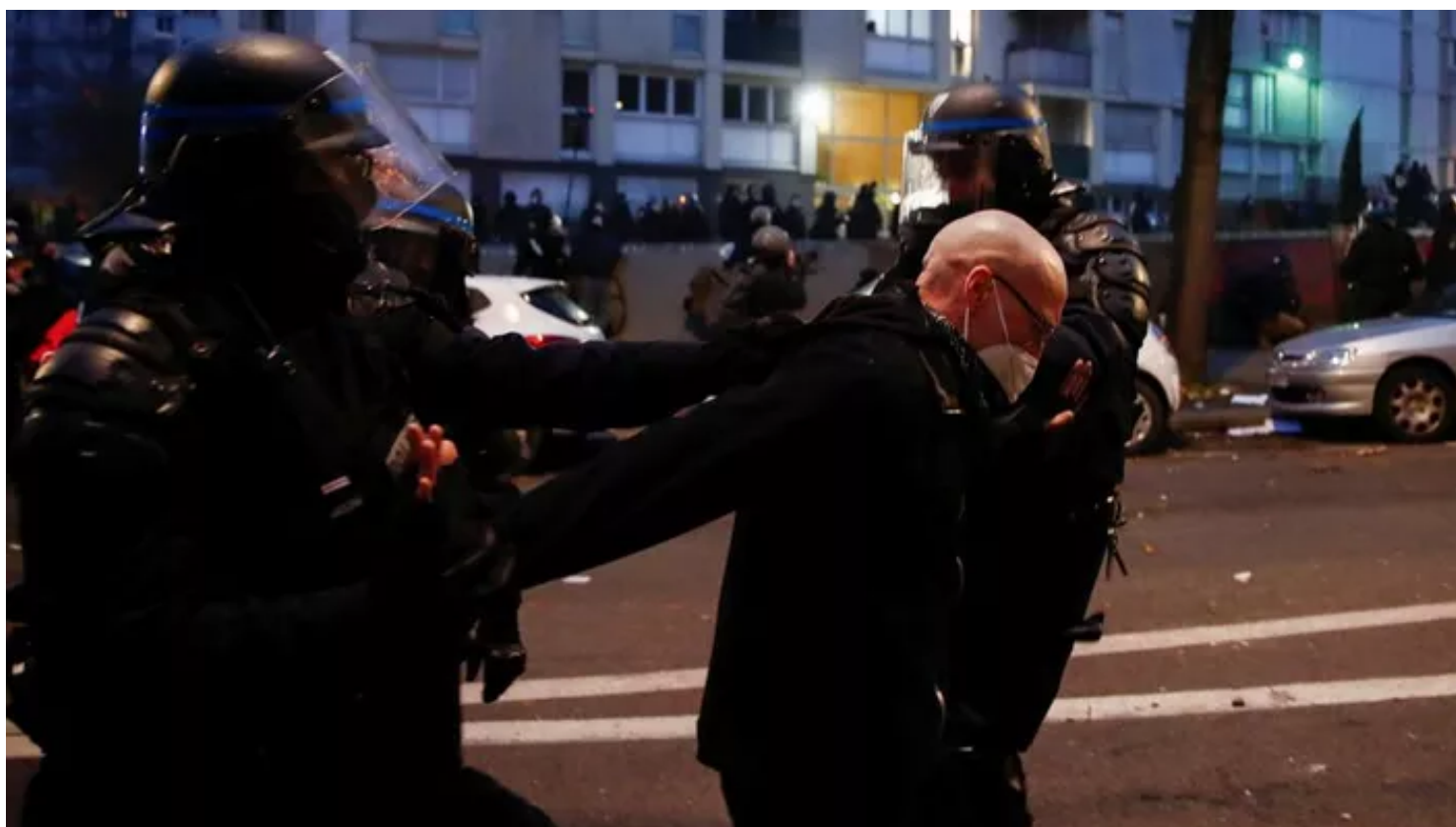
Un homme arrêté samedi 5 décembre à Paris.

Par Le Figaro avec AFP Publié il y a 29 minutes, Mis à jour à l'instant