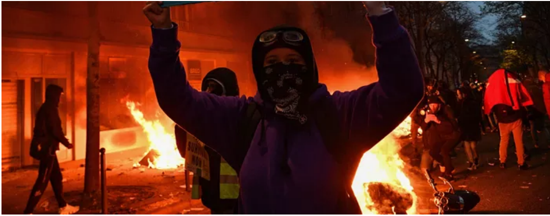
Dans les rues de Paris samedi.

Un pompier a également été blessé par un jet de projectile à Paris, a indiqué une source policière.