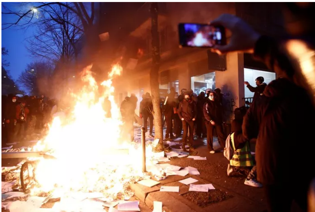
Une agence bancaire a été pillée samedi dans le 20e arrondissement.

Selon la place Beauvau, il y a eu 95 personnes arrêtées en France. 42 d'entre elles l'ont été à Paris. Le parquet de Paris a de son côté fait état de 25 personnes placées en garde à vue, dont deux mineurs. La majorité des gardés à vue le sont pour « participation à un groupement formé en vue de la commission de violences », selon la même source. Une personne est entendue pour « violences volontaires sur personne dépositaire de l'autorité publique », a ajouté le parquet.