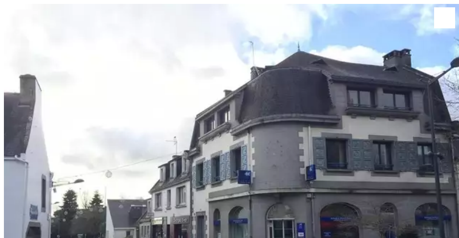
Un projet immobilier verra le jour le long des rues du presbytère et de Kervam.