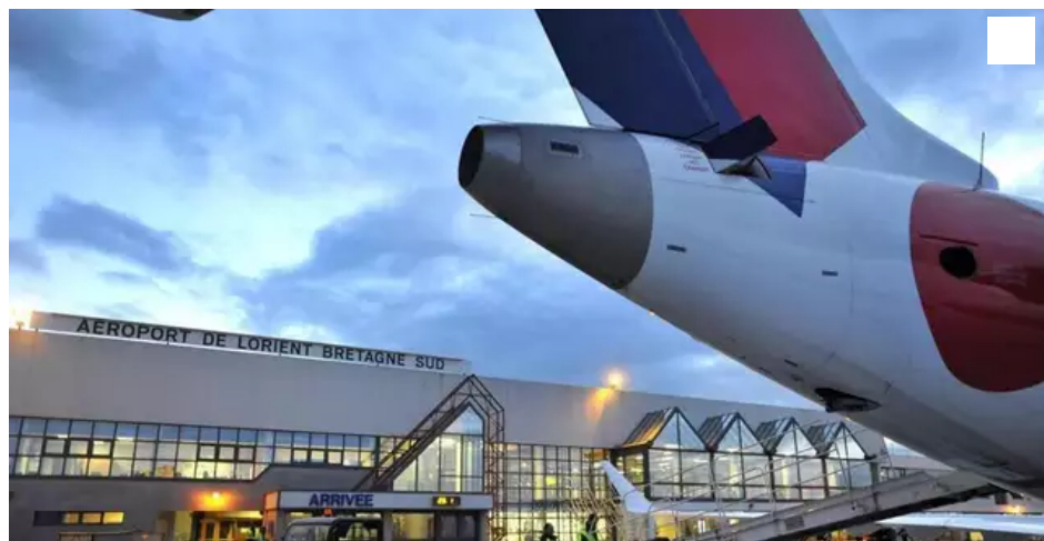
Air France fermera ses lignes depuis Lorient (Morbihan) en mars 2021.

Le maire de Lorient (Morbihan) reste optimiste sur l'avenir de l'aéroport de Bretagne-Sud, qu'il voit comme un « complément » de l'aéroport de Nantes.