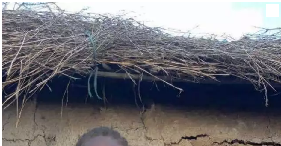
Trois jeunes filles devant une maison typique Maasaï.

Les membres de Terres de Couleurs, association basée à Pløemeur, ont choisi la date du 6 février 2021 pour mener leur assemblée générale, mais de façon virtuelle, via les réseaux sociaux.