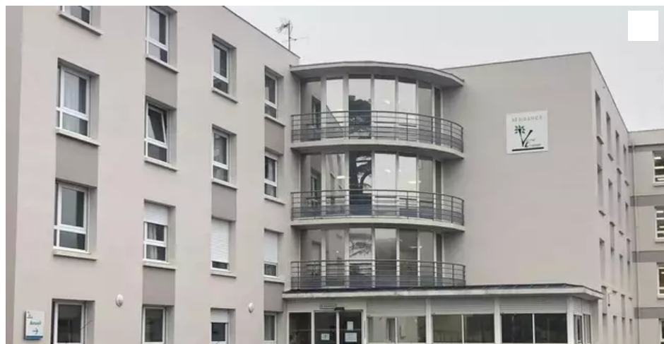
Les visites restent interdites à l'Ehpad Victor-Ecomard de Sainte-Pazanne.

Le virus s'est installé il y a dix jours à l'Ehpad Victor-Ecomard de Sainte-Pazanne. Depuis, 52 résidents sur 70 et 16 personnels ont été testés positifs. Son directeur avoue se sentir bien seul.