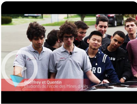
Figaro_Ecole Saint Hilaire_Reportage