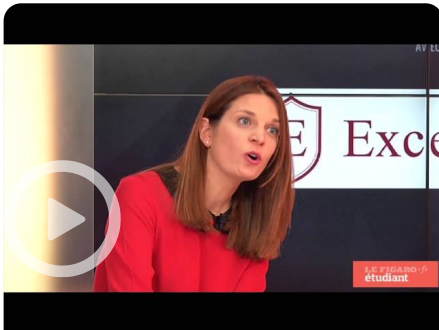
Cas d'écoles Excellencia