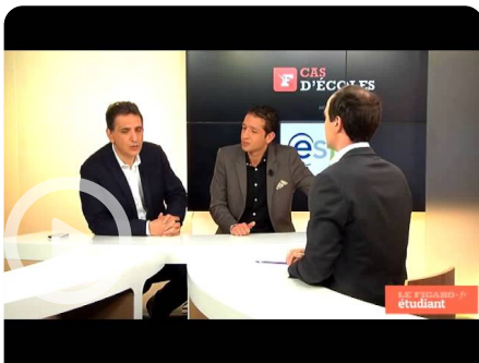
Cas d'écoles Saint Hilaire