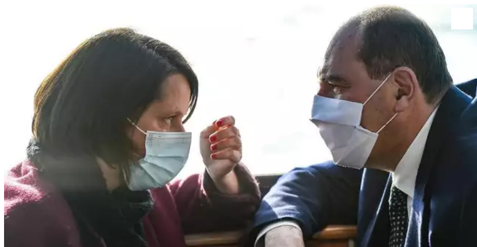
Johanna Rolland et Jean Castex, les yeux dans les yeux ce vendredi 26 février 2021 à Nantes

Le Premier ministre a signé ce vendredi 26 février 2021 la déclinaison locale du Contrat de relance et de transition écologique mis au point entre l'État et les métropoles françaises. Jean Castex a fait des promesses à Johanna Rolland, maire PS de Nantes. L'enveloppe de l'État pour le futur CHU remonte à 416 millions d'euros. L'État promet aussi de soutenir la réhabilitation de la cathédrale et d'œuvrer pour le confort sonore des riverains de l'aéroport.