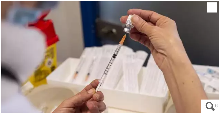
En France, la Haute autorité de santé recommande désormais de réserver le vaccin AstraZeneca aux plus de 55 ans.

Le jeune homme de 24 ans, qui était « sportif » et avait « une parfaite hygiène de vie » selon sa famille, est mort d'une thrombose dans la nuit du 18 mars, dix jours après avoir reçu une première dose du vaccin AstraZeneca.