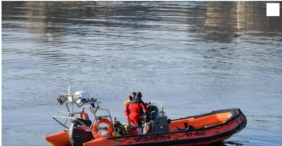
Les secours sont obligés de se mobiliser pour secourir ces personnes qui sautent dans l'Erdre.

Ces derniers jours à Nantes, des jeunes gens s'amuse à sauter dans l'Erdre, puis regagnent la rive avant l'arrivée de la police. A chaque fois, les secours se sont mobilisés pour rien.