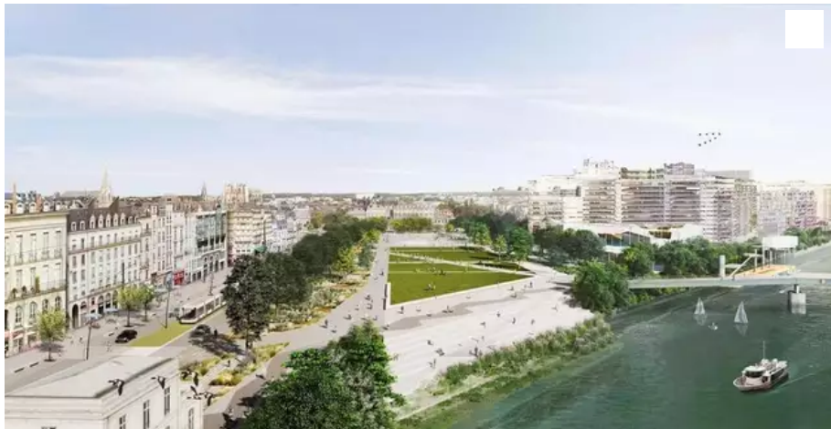
Les travaux d'aménagements de la Petite Hollande et de Gloriette devraient débuter en 2024.

Le traumatisme des comblements de la Loire au XXe siècle a eu des répercussions directes sur la dimension du quai de la Fosse. Et les projets d'aménagements du site se poursuivent au XXIe siècle.