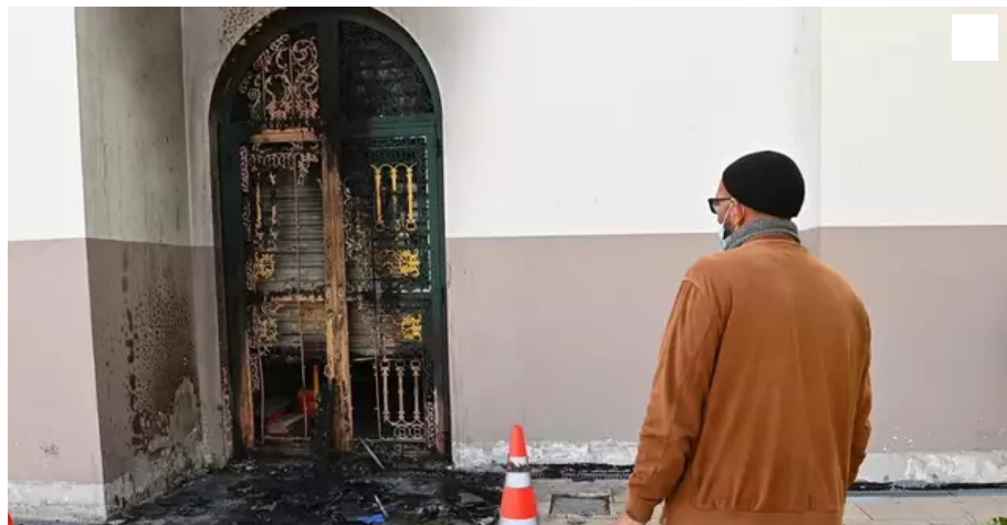
Une porte d'entrée de la mosquée Arrahma a été incendiée dans la nuit de jeudi à vendredi.

L'enquête progresse sur l'origine de l'incendie à la mosquée Arrahma, à Nantes. L'entrée du bâtiment a été détruite par les flammes, dans la nuit de jeudi 8 au vendredi 9 avril. L'acte serait celui d'un homme seul, alcoolisé, sans revendications.