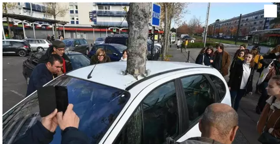
L'arbre qui transperce une voiture en 2019 : une œuvre de Royal de Luxe qui a surpris le quartier Bellevue... avant de finir incendiée.

422 000 €, c'est la subvention que touchera en 2021 la compagnie nantaise Royal de luxe de la part de Nantes métropole, des villes de Nantes et de Saint-Herblain. Mais avant de signer pour 21 000 €, des élus herblinois demandent un bilan.