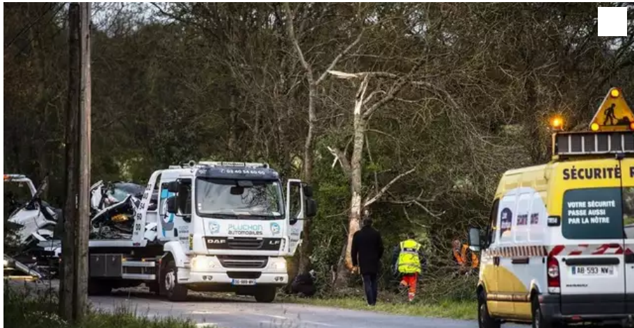
Accident mortel dans le vignoble nantais à Saint-Hilaire de Clisson.

Trois jours après l'accident qui a coûté la vie à deux hommes vendredi après-midi à Saint-Hilaire-de-Clisson, l'un des passagers qui se trouvait à l'arrière de la Tesla accidentée est sorti du CHU.