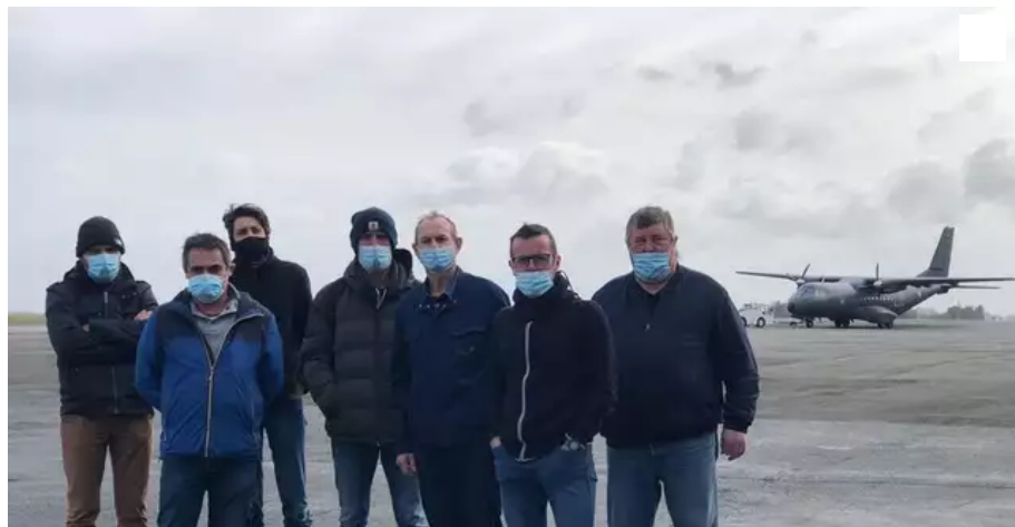
Les représentants du personnel de la Sabena Technics, près de Saint-Malo, attendent des réponses du ministre de l'Économie, Bruno Le Maire.

Le ministre de l'Économie est attendu à Saint-Malo, ce vendredi 23 avril. Les salariés de la Sabena Technics, qui viennent de perdre un contrat d'État, attendent des réponses.