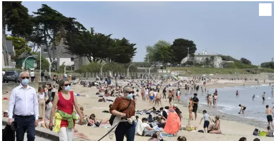
Du monde à la plage de Toulhars et sur la promenade qui la longe, à Larmor-Plage.

Les magasins fermés en ville et une météo clémente ont vite fait d'inciter les gens à filer sur le littoral lorientais (Morbihan) ce samedi 24 avril 2021.