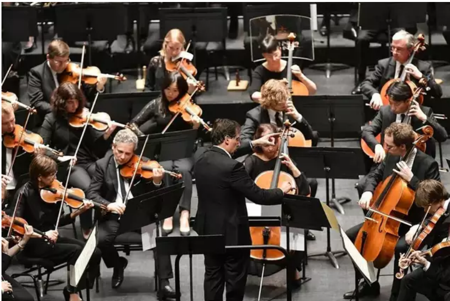
Les musiciens de l'Orchestre national des Pays de la Loire sous la direction de Pascal Rophé. ? © Marc Roger / Archives Ouest-France

« L'ONPL est l'un des emblèmes les plus visibles des Pays de la Loire, un élément de l'unité régionale. En cinquante ans, les collaborations avec les villes, départements, salles, théâtres, festivals, lieux prestigieux comme l'abbaye de Fontevraud... ont été amplifiées. On travaille avec Angers-Nantes Opéra, le Centre national de danse, la Folle Journée... On a développé les tournées dans les départements et à l'étranger, mais aussi les prestations pour le faire rayonner . On participe aux grands événements régionaux.