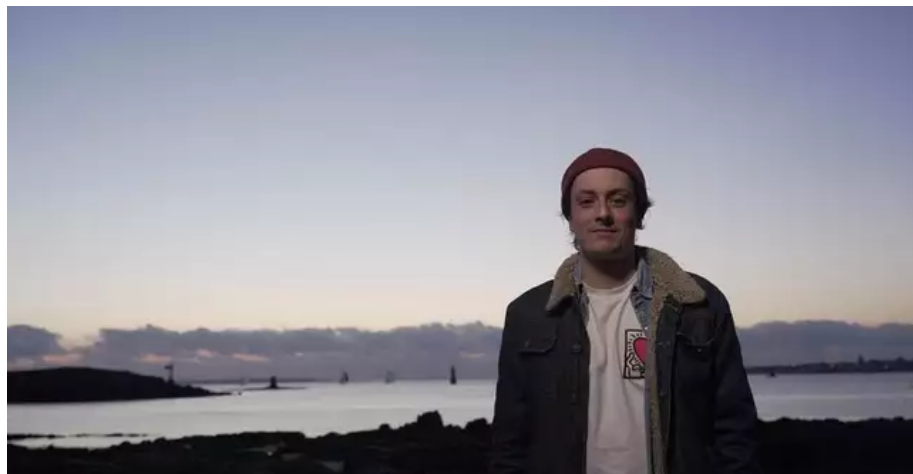
OJÛN, une création musicale de Guillaume Chartin.

«C'est notre histoire » est une exposition itinérante retraçant l'histoire de l'esclavage et de ses héritages du XV e au XX e siècle dans l'espace français. Elle donne des clés pour mieux comprendre comment l'histoire de l'esclavage, s'inscrit dans le récit national, et explique en quoi les combats pour l'abolition ont nourri la construction des valeurs de la République.