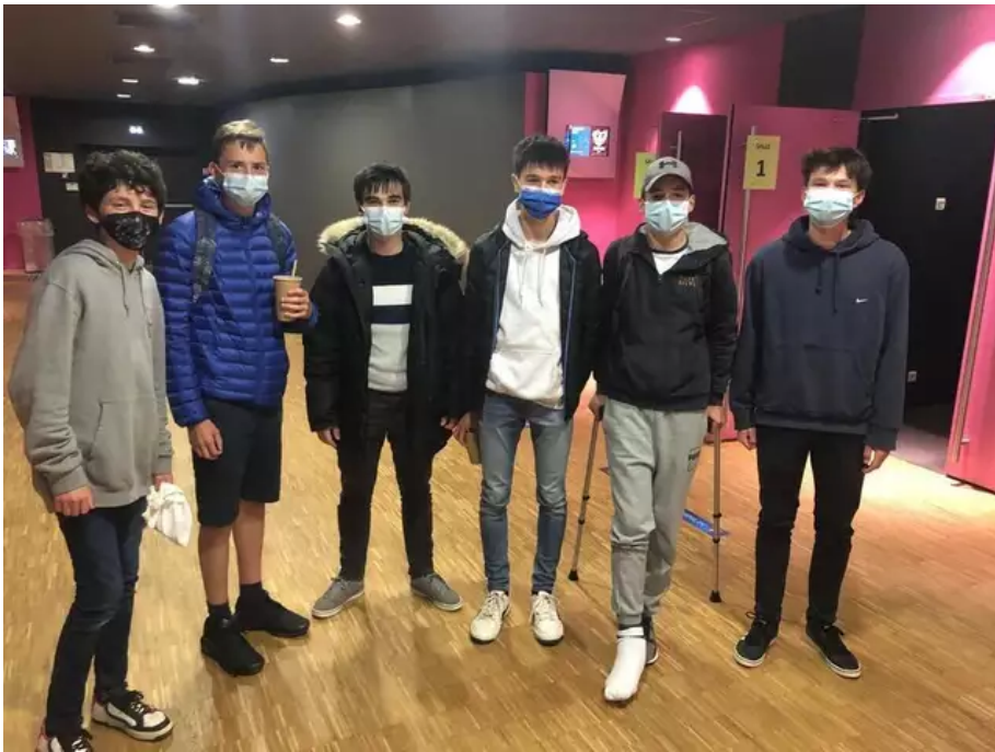
Un groupe de collégiens venu se faire une toile bien méritée après l'oral du brevet.