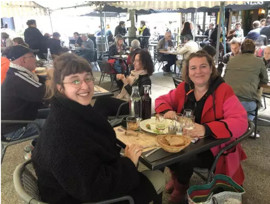
Du sourire aux terrasses de la Taverne du Roi Morvan, cela fait du bien, comme une renaissance.

Sans parler des nombreux magasins considérés comme « non-essentiels » qui reprennent à leur tour du service.