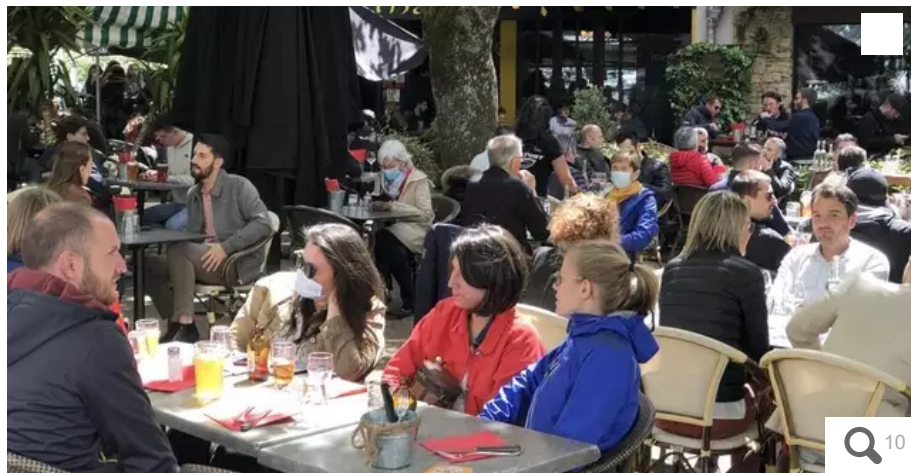
Place Monjarret, c'est le retour des terrasses remplies : il fallait réserver pour trouver une place à Lorient.

Ce mercredi 19 mai 2021 était attendu autant des professionnels que des clients. En ce jour de déconfinement, premiers instantanés à Lorient (Morbihan).