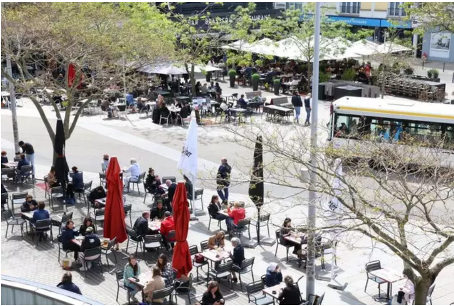
Une place Aristide-Briand, ce mercredi midi, inondée de soleil et noire de monde dans quasiment tous ses restaurants...

Enigme. Quelle lettre complète cette suite logique ?