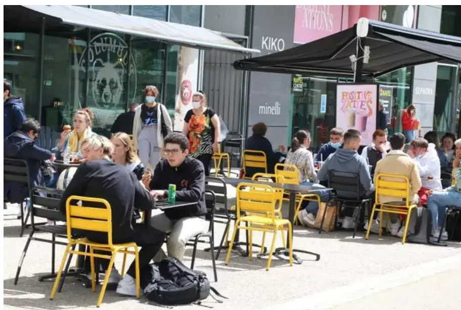
Devant le centre commercial Nayel, la grande terrasse au soleil a été prise d'assaut par un public plutôt très jeune.

Il aura fallu s'armer de patience mais enfin, ce mercredi 19 mai 2021, de nombreux lieux publics ont rouvert leurs portes. Terrasses, cinémas, musées : on en a profité pour faire un petit tour de Lorient (Morbihan) et prendre quelques photos.