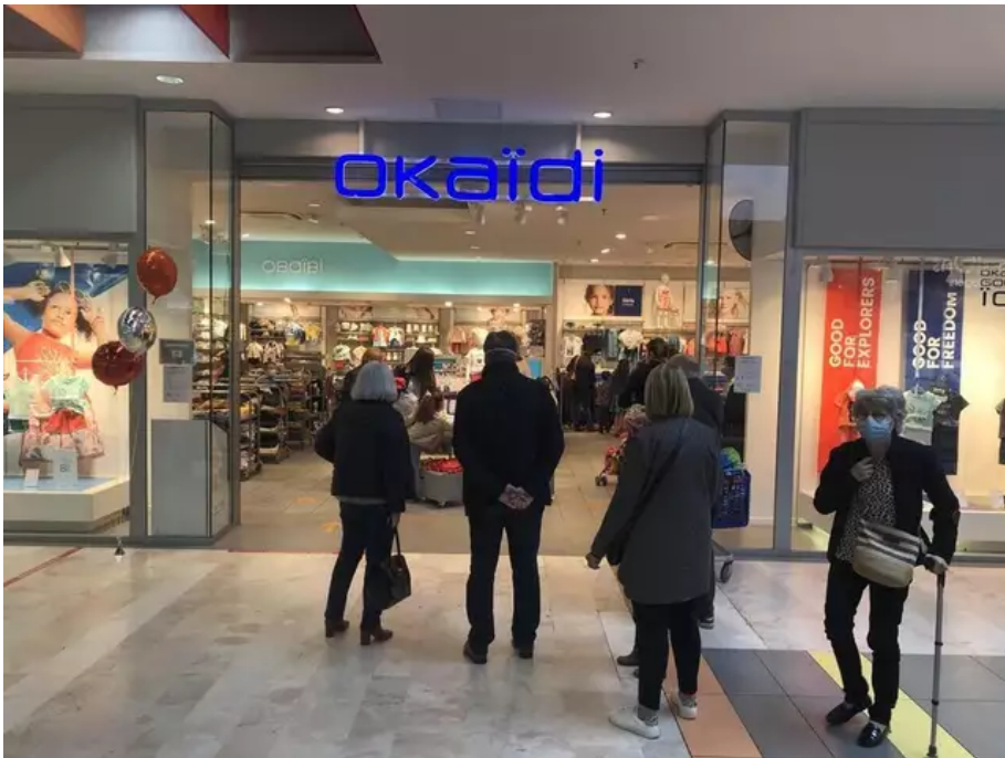
Dans la galerie commerciale du K2 à Lorient, si l'affluence est mesurée en matinée, il faut savoir patienter néanmoins. C'est le cas devant l'enseigne Okaidi, reflète que les vêtements et chaussures (pour enfants) sont bien essentiels, quoiqu'en dise le gouvernement.

Suivez notre direct du mercredi 19 mai 2021 consacré au déconfinement .