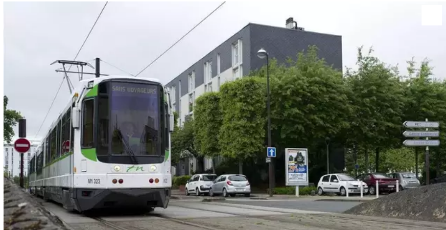
L'homme a bloqué la circulation du tramway avant d'être interpellé.

Un homme de 29 ans a été placé en garde à vue après avoir empêché la circulation du tramway ce vendredi 21 mai, à 20 h 40, à l'arrêt Neustrie à Bouguenais.