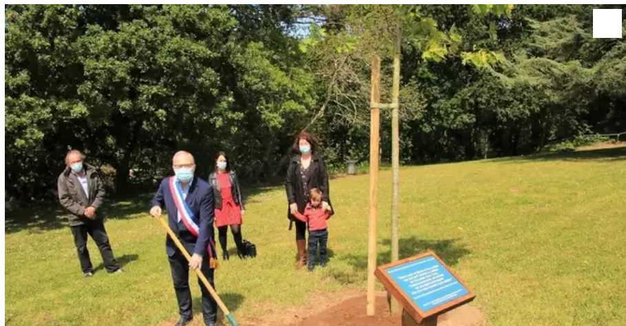
Le maire de Lorient, Fabrice Loher, entouré de membres du conseil municipal.

À l'occasion de la Journée nationale en hommage aux victimes de l'esclavage, un arbre de la Liberté, un chêne rouge, a été planté samedi 22 mai 2021, au matin, par le maire de Lorient (Morbihan), Fabrice Loher accompagné de membres du conseil municipal.