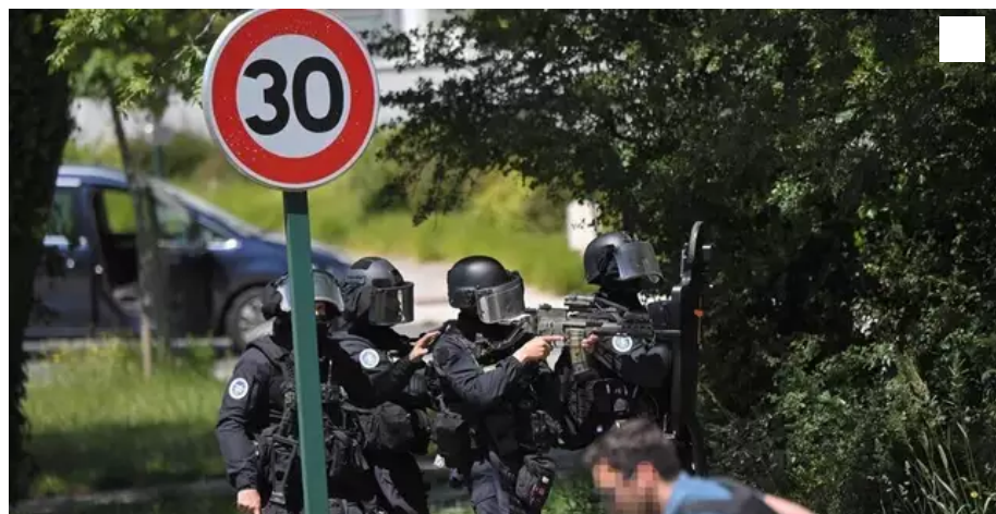
Le GIGN est sur place à La Chapelle-sur-Erdre.

L'homme qui a porté plusieurs coups de couteau à une policière municipale dans les locaux de la police municipale de La Chapelle-sur-Erdre a succombé à ses blessures. Il avait ouvert le feu et blessé deux gendarmes, avec le pistolet dérobé à l'agent municipale.