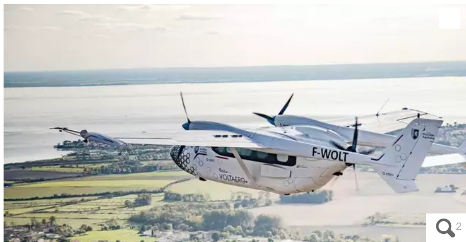
Un avion hybride électrique décollera de l'aéroport de Lorient Bretagne sud, lundi 5 juillet pour un tour de France des territoires.

C'est une première et c'est du sol breton que le premier avion hybride va s'élancer pour un tour de France. À Lorient (Morbihan), précisément.