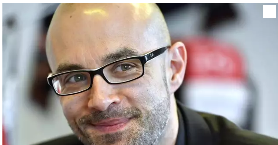
Gwendal Rouillard, député LREM de la 5e circonscription du Morbihan (Lorient).

Les professionnels des TP menacent de bloquer le Tour de France, à cause de l'entrée en vigueur de la taxation du gazole non routier plus tôt que prévu. Le député LREM de la 5e circonscription du Morbihan, Gwendal Rouillard, y est opposé.