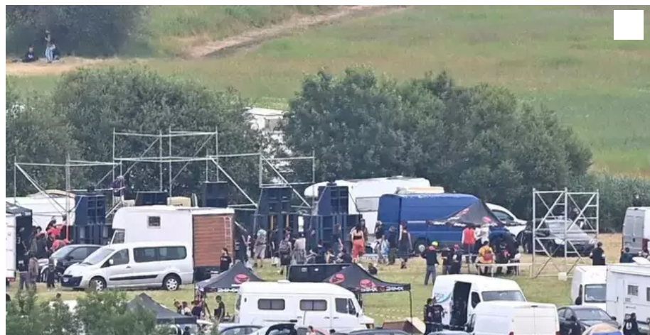
Plus de 400 gendarmes bouclent le secteur de l'hippodrome de Redon, samedi 19 juin 2021.

Un jeune homme a eu la main arrachée et cinq gendarmes ont été blessés dans la nuit de vendredi 18 à samedi 19 juin, à Redon (Ille-et-Vilaine), lors d'affrontements entre forces de l'ordre et participants à une rave party. Les organisateurs du « Teknival des musiques interdites » dénoncent le choix « de la violence par les autorités en lieu et place de dialogue ». Et rappellent la mort de Steve Maia Caniço, il y a tout juste deux ans à Nantes.