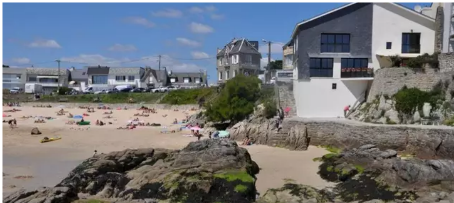
Aujourd'hui, les jeunes aiment se retrouver sur la plage du Pérello.

À quelques encablures de la plage dite du « Grand Pérello », on trouve la plus discrète et plus sauvage plage du « Petit Pérello ». La couleur de l'eau y est parfois digne des mers tropicales. Au-dessus de ce petit joyau, le Fort du Talud domine la pointe du même nom.