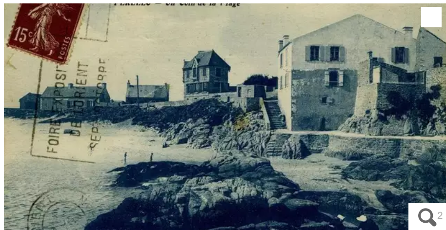
La plage vue de la cale au début du XXe siècle

Entre Lomener et Kerroch, Le Pérello est une plage très prisée par les jeunes du Pays de Lorient (Morbihan). Elle fut un port de pêche important au début du XXe siècle.