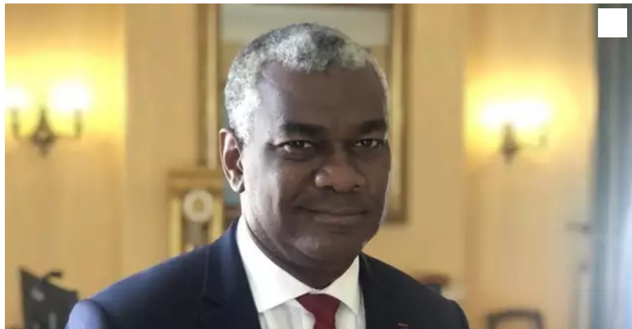
Joël Mathurin, préfet du Morbihan, à Vannes le 21 juillet 2021

Joël Mathurin, préfet du Morbihan, confirme que le département s'apprête à dépasser le seuil d'alerte de 50 cas pour 100 000 habitants. Et retient trois priorités pour freiner la flambée épidémique cet été.