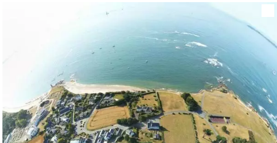
Photo du site concerné par le projet de lotissement près de Kerpape, prise à partir d'un drone par l'association Tarz Héol. © Archives Tarz Héol

La cour administrative d'appel de Nantes a annulé le permis d'aménager accordé en 2019, pour un projet de lotissement envisagé près du centre de Kerpape à Plœmeur (Morbihan).