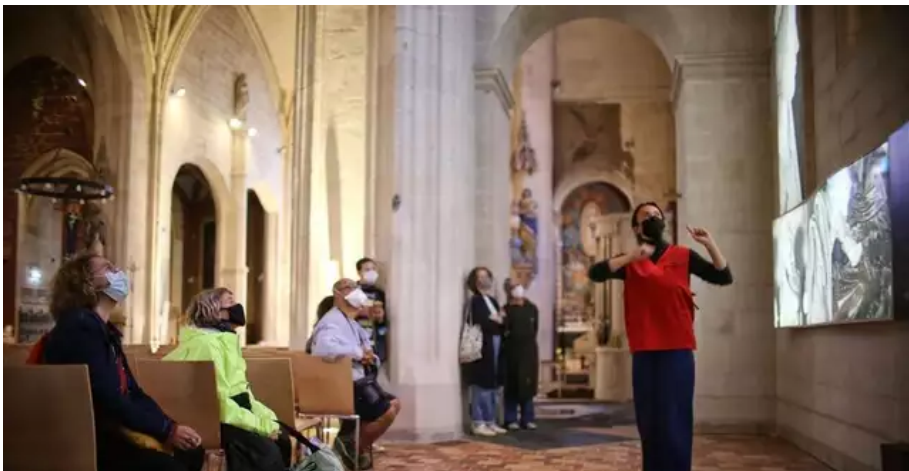
Crochet par la Chapelle de l'Immaculée, pour une partie de l'exposition photo dédiée à la cathédrale de Nantes.

Amis de la cathédrale : suivez la guide !