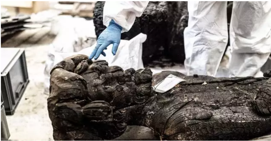
Seuls quelques cariatides et tuyaux pourront être restaurés, le reste a disparu dans les flammes.

Au-delà de sa valeur instrumentale unique, le grand orgue pouvait donc se targuer d'une grande valeur historique et patrimoniale. « Un mélange d'histoire et de modernité », résume Michel Bourcier. Sur le buffet, une fraction de l'histoire de Nantes prenait (presque) vie : des cariatides (sculptures) d'hommes sirènes du XVIIIe siècle, semblables aux proues de bateau. « L'influence du port représentée jusqu'ici », explique Juliette Leroy, guide pour les Amis de la cathédrale.