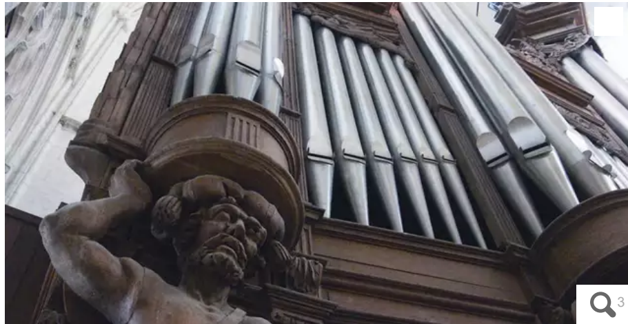
Perché sur sa tribune de l'avant-nef, le grand orgue faisait résonner ses notes dans toute la cathédrale.

Série d'été. Un incendie, une révolution, une guerre... Pendant quatre siècles, le grand orgue de la cathédrale de Nantes avait résisté à tout. Jusqu'aux flammes de l'année dernière.