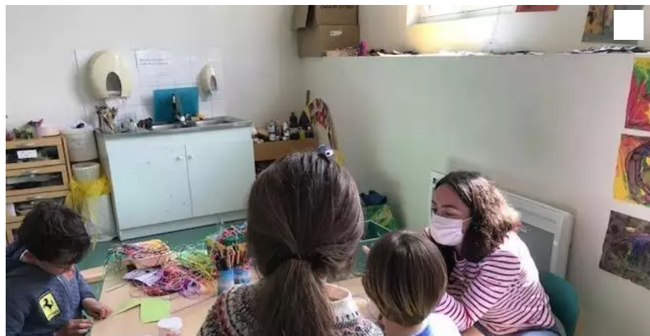
Au regard de la situation, l'Accoord renforce son protocole sanitaire.

L'Accoord est confrontée à une hausse inquiétante de cas de Covid-19, à Nantes. Depuis samedi 10 juillet, le centre de loisirs a recensé une vingtaine de personnes positives au virus et près de 400 personnes ont été placées en isolement.