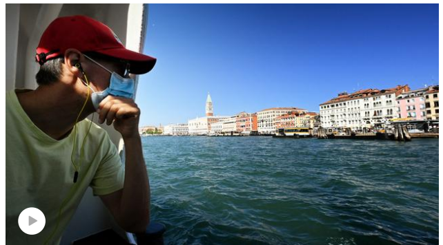
Ces Français qui partent en vacances en Italie malgré la pandémie