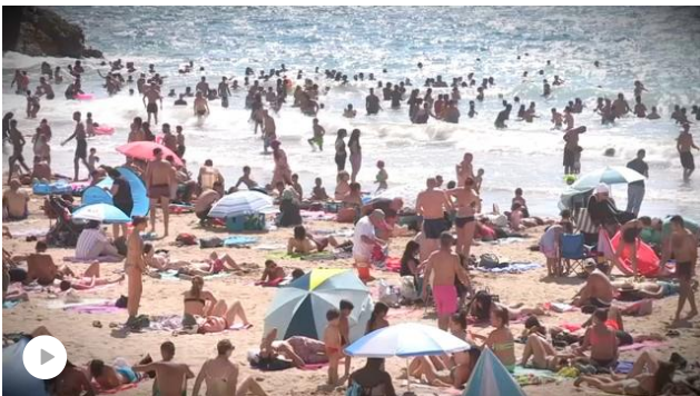
Marseille ne veut pas (trop) de touristes cet été