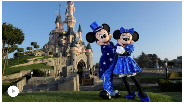
Parcs d'attractions : comment se profile la réouverture ?