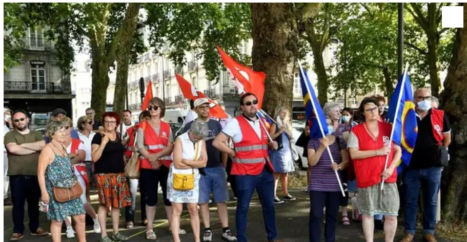
Le 21 juillet, l'appel de FO avait donné lieu à une faible mobilisation contre le « passe-licenciement ».

Les deux unions départementales CGT et FO appellent à rejoindre la manifestation du samedi à Nantes.