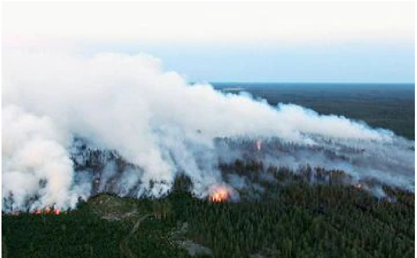
La Finlande subit son plus grand feu de forêt depuis 50 ans