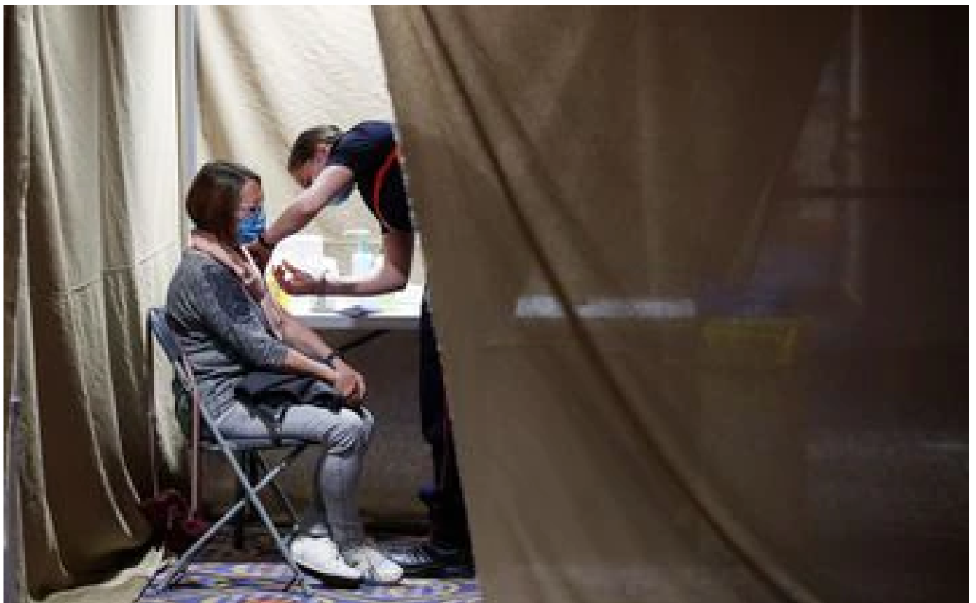
Hérault : les jeunes de 18-25 ans recevront des cadeaux s'ils se font vacciner