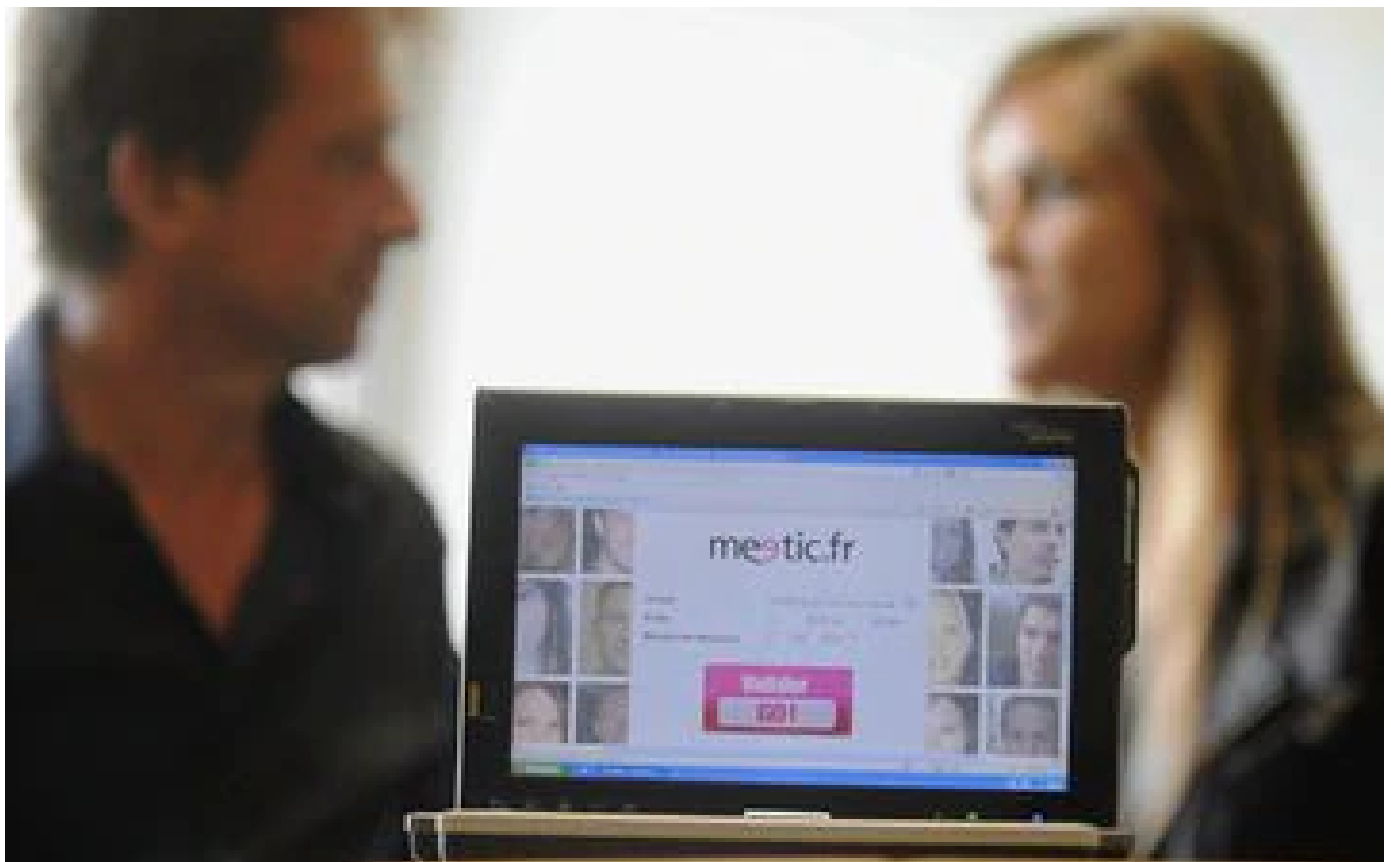
Abonnés Le vaccin, la botte secrète qui rassure sur les sites de rencontres