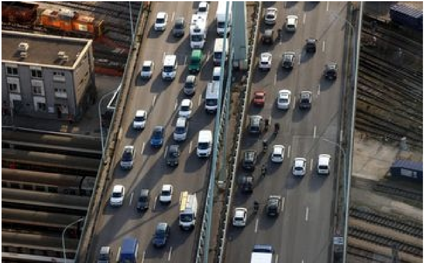
Départs en vacances : plus de 1000 km de bouchons en France ce vendredi après-midi