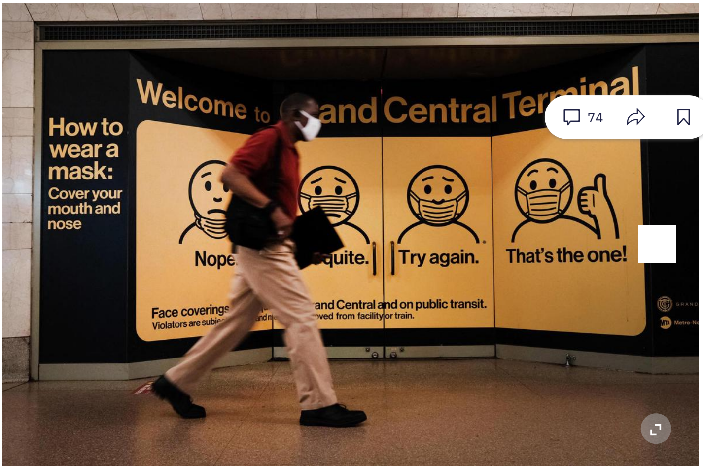
A la gare de Grand Central à New York, le 27 juin 2021

Moins de quatre semaines après avoir célébré la fête nationale, tout sourire et sans masque au milieu d'un millier d'invités à la Maison Blanche, Joe Biden, qui promettait un «été de liberté» à ses compatriotes, a dû prendre jeudi une série de mesures pour relancer la vaccination, en panne après un démarrage tambour battant. Image symbolique, pour la première fois depuis des mois, le président américain est entré dans la salle où l'attendaient les journalistes avec un masque noir.