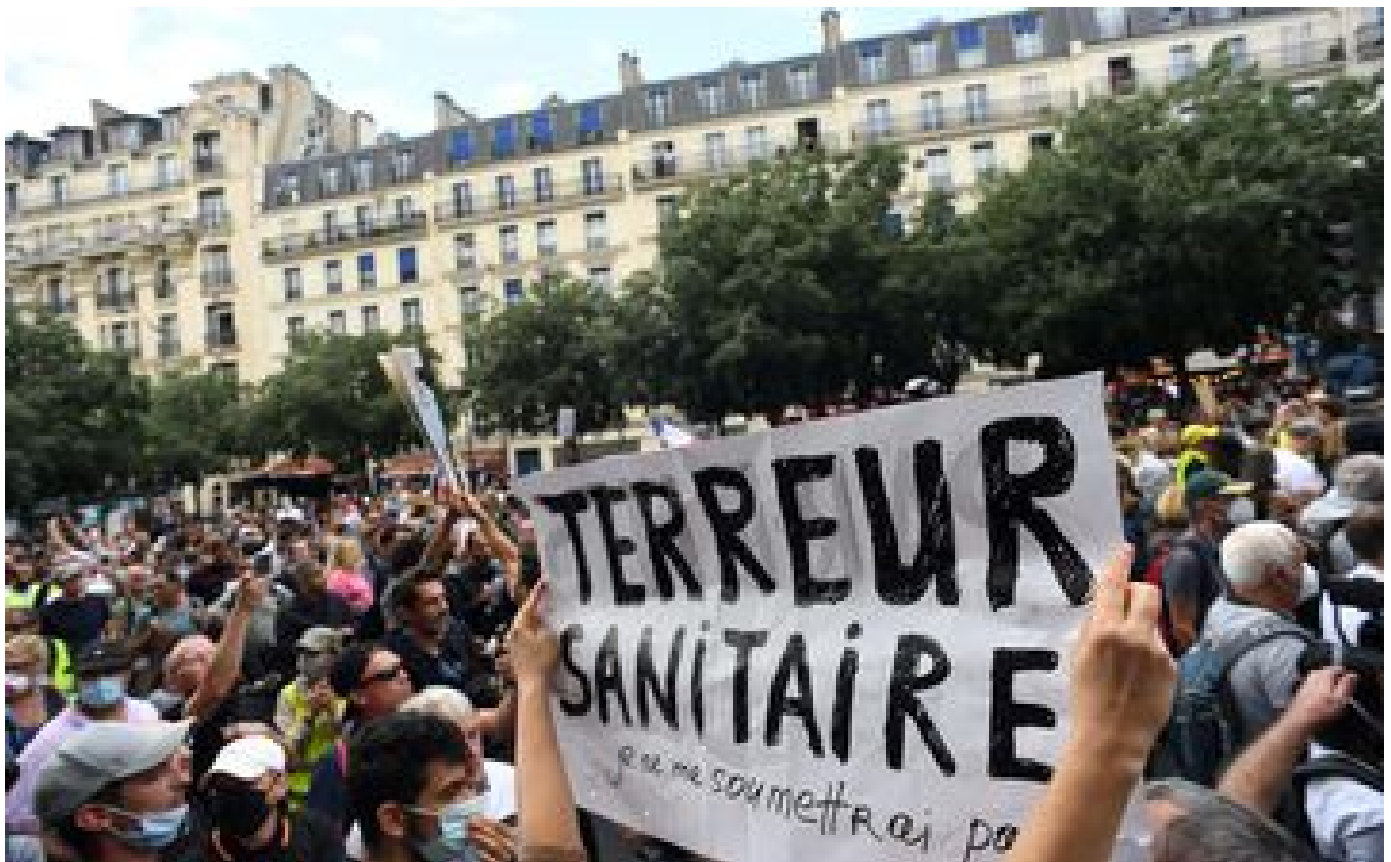
Abonnés Journalistes adressés : nournuini certains manifestants anti-nass sanitaire en veulent tant aux https://www.leparisien.fr/societe/cauchemar-a-laeroport-plus-de-30-heures-de-retard-pour-un-vol-nantes-malaga-01-08-2021-WY6BAOEK4RBON... 4/5