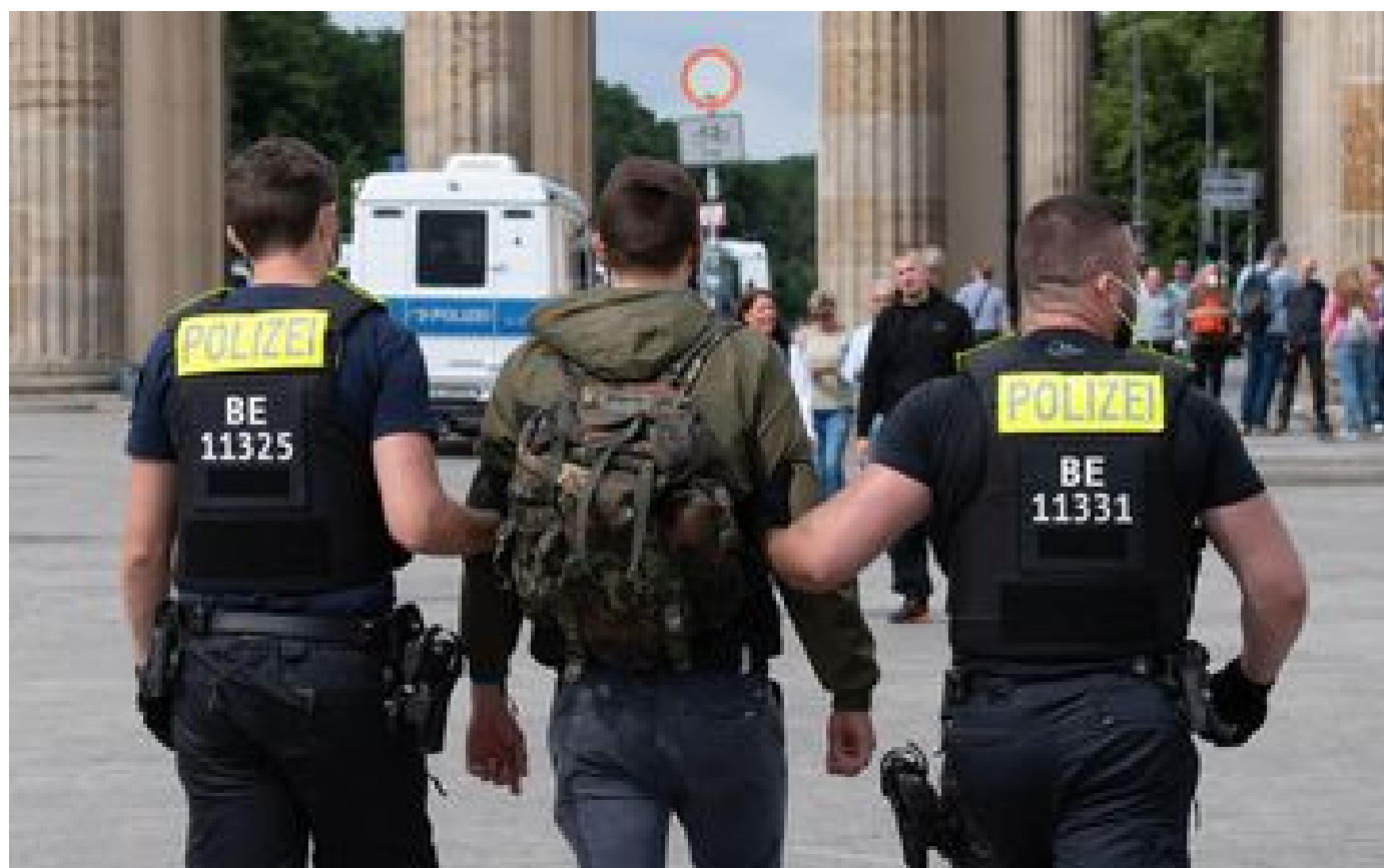
Allemagne : échauffourées à Berlin lors de manifestations anti-confinement

... pour que les manifestants anti-pass sanitaire se réunissent sans danger. médias ?