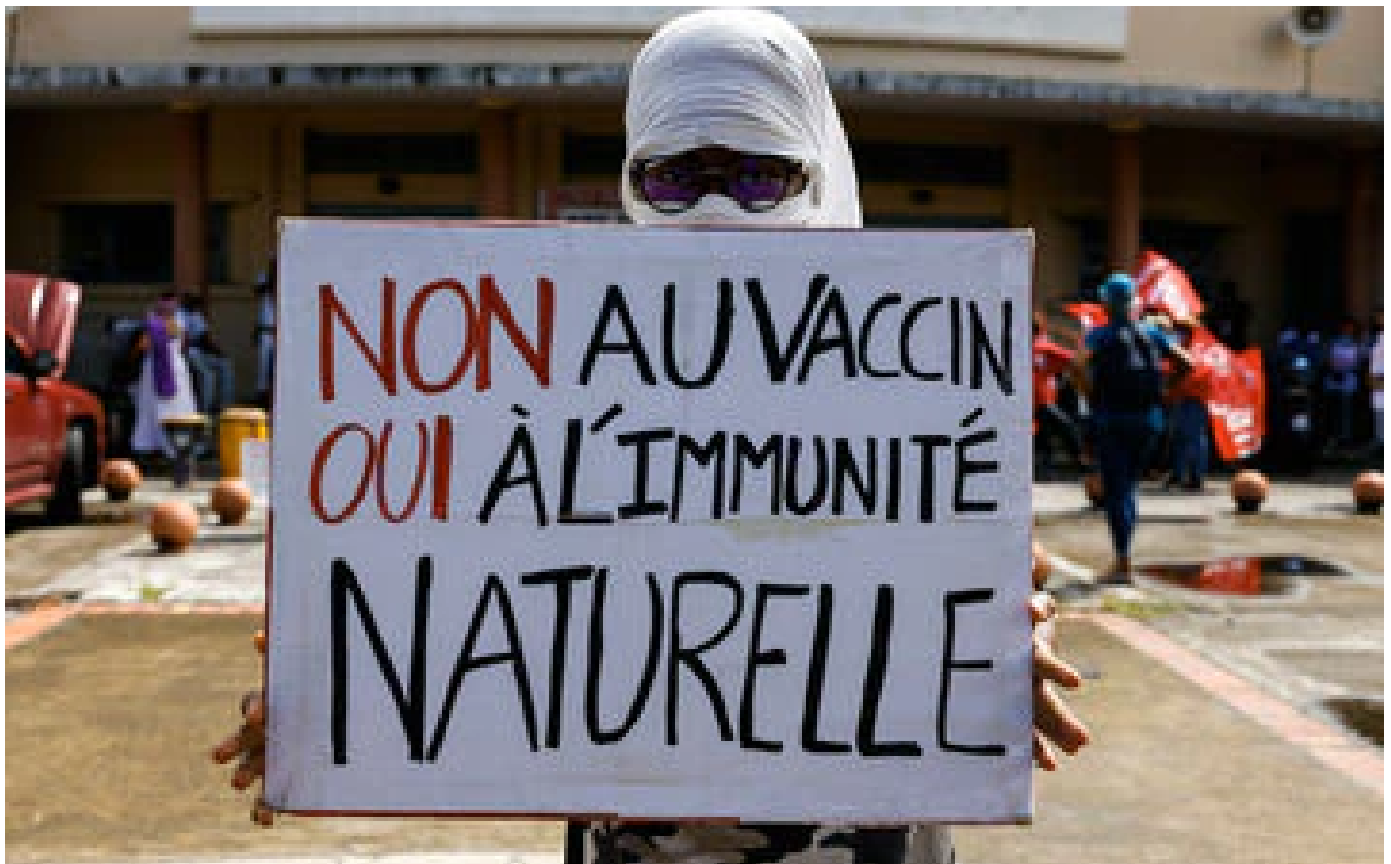
Abonnés En Martinique, le vaccin mis à mal par les croyances : «On s'est toujours soignés avec les plantes du pays»