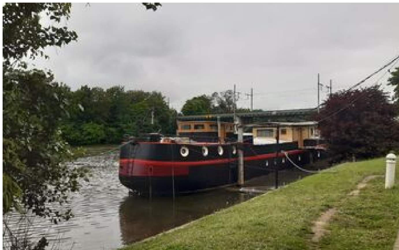
Abonnés Traversée du Grand Paris, étape 12 : entre Vaucresson et Sartrouville, dans les pas des impressionnistes