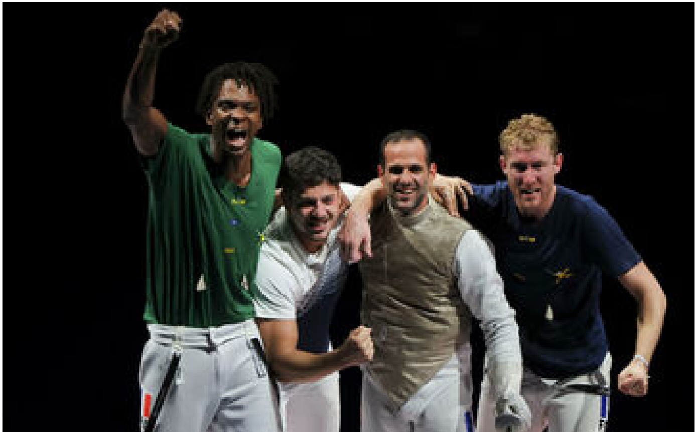
Abonnés Les Hauts-de-Seine, terre d'escrime qui a récolté les médailles aux JO de Tokyo