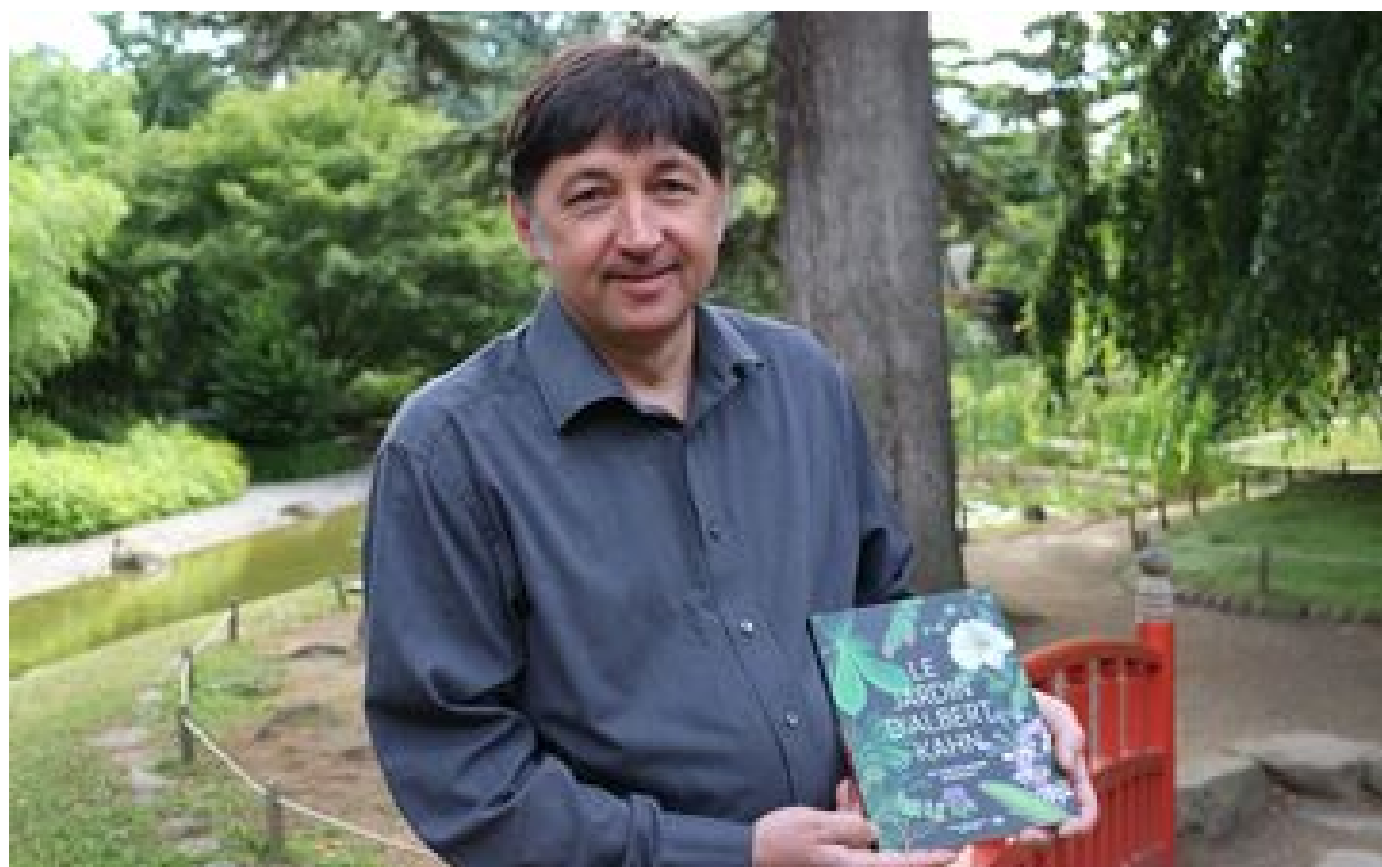
Hauts-de-Seine : le jardin Albert-Kahn s'offre un nouveau guide de 96 pages