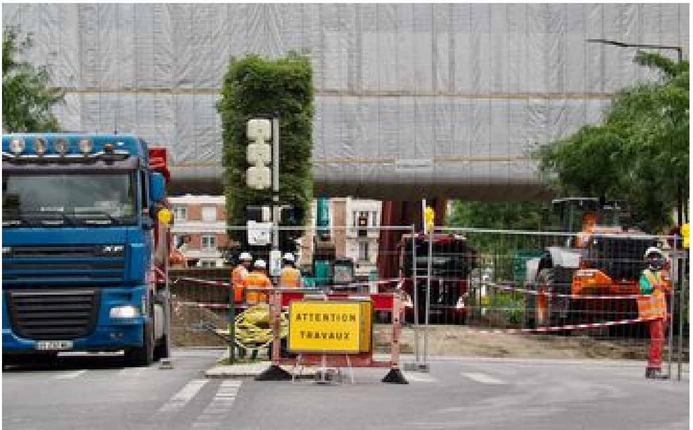
Suresnes : la démolition de la passerelle des Arts a commencé