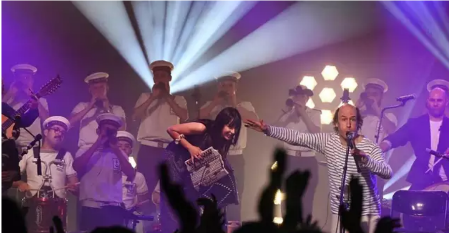
Le bagad de Lann-Bihoué accompagne régulièrement Carlos Núñez. Il y a de bonnes habitudes...

C'est un chercheur, un voyageur, qui à travers les siècles nous ramène à l'époque médiévale, s'entourant de fidulas pour interpréter L'hymne aux pèlerins nous menant sur le chemin de Compostelle.