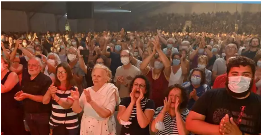
Un espace Marine affichant complet et des sourires qui se lisent même sous les masques.

Que dire du Celtic Beethoven qu'il honore pour son amour de la musique modale celtique. Des mélodies emportées qui brisent les carcans où l'on catalogue le tradi ou le classique.