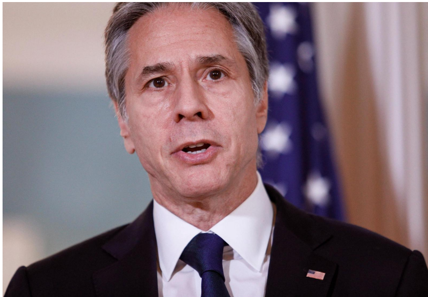
Le secrétaire d'Etat américain, Antony Blinken

Les autorités russes ont quant à elles affirmé qu'Antony Blinken et Sergueï Lavrov avaient discuté des «contacts de l'ambassade de Russie avec les représentants de toutes les principales forces politiques d'Afghanistan dans l'intérêt d'aider à assurer la stabilité et l'ordre public».