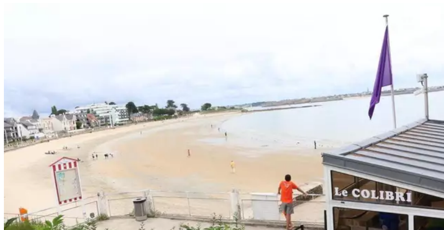
Pavillon violet plage Toulhars ce mardi midi : elle est fermée après qu'une pollution aux hydrocarbures a été détectée.

Drapeau violet à Toulhars, Port-Maria et Kerguelen à Larmor-Plage (Morbihan) : ces plages de Larmor sont victimes d'une pollution aux hydrocarbures. Elles demeurent fermées aux usagers, ce vendredi 20 août 2021.