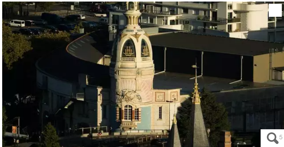
Une des deux tours de l'usine LU, reconstruite à l'identique près de l'Erdre. ? © Franck Dubray, Ouest-France

Quatrième volet de notre série sur les lieux culturels emblématiques, avec le Lieu unique de Nantes. L'ancienne biscuiterie LU est devenue un espace de vie et de culture.