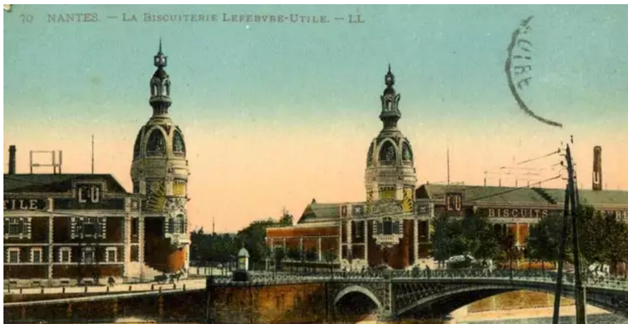
L'ancienne usine LU et ses deux tours ont fait la fierté de l'industrie nantaise.