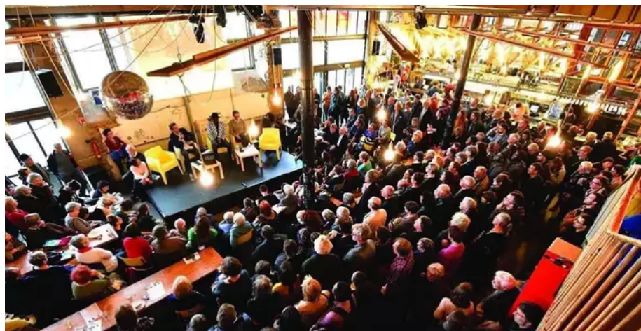
Le Lieu unique se prête aux spectacles comme aux débats (ici, lors du Festival des littératures). Son bar (au fond) fait partie de l’ADN du lieu.

d’exposition. C’est un lieu de vie, de refuge. » Pour Fleur Richard, « le restaurant ou le bar sont aussi importants que la salle d’exposition. Ça fait partie de l’ADN du lieu. »