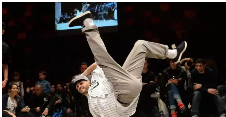
Battle de hip-hop.

« Le bâtiment et la tour ont été refaits à l’identique sous l’égide des Bâtiments de France, précise Fleur Richard, secrétaire générale du Lieu unique. C’est un site classé, avec la volonté de préserver ce patrimoine industriel. » Le logo du Lieu unique (et son nom) fait référence à la biscuiterie LU. Quant à la salle de spectacle, pouvant accueillir 530 spectateurs assis ou 1 200 debout, on y retrouve des éléments de l’histoire coloniale de la ville avec des bidons de Bamako ou des coursives en planches de bois provenant du chantier naval de Guilvinec.