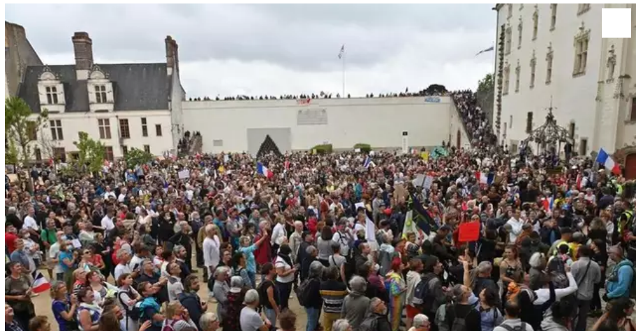
Les manifestants anti-pass sanitaire ont envahi le château des ducs de Bretagne, à Nantes.

Comme lors des deux derniers samedis, la manifestation contre le pass sanitaire s'est déroulée sans heurt. Seul coup d'éclat, les milliers de manifestants ont pris d'assaut le château des ducs de Bretagne, prenant par surprise les touristes.