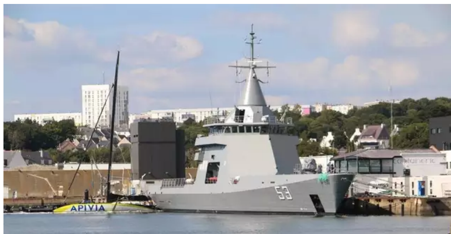
Le Storni, qui mouille actuellement quai Est aux côtés de l'Imoca Apivia, devrait être livré à la Marine argentine dans les semaines à venir.

Outre la construction des trois patrouilleurs hauturiers, le contrat d'environ 300 millions d'euros passé, au printemps 2018, entre Naval Group et la Marine argentine prévoyait la livraison d'un autre patrouilleur, l'Adroit rebaptisé Bouchard . Propriété de la Marine nationale depuis 2011, celui-ci a été révisé, modernisé et livré en décembre 2019.