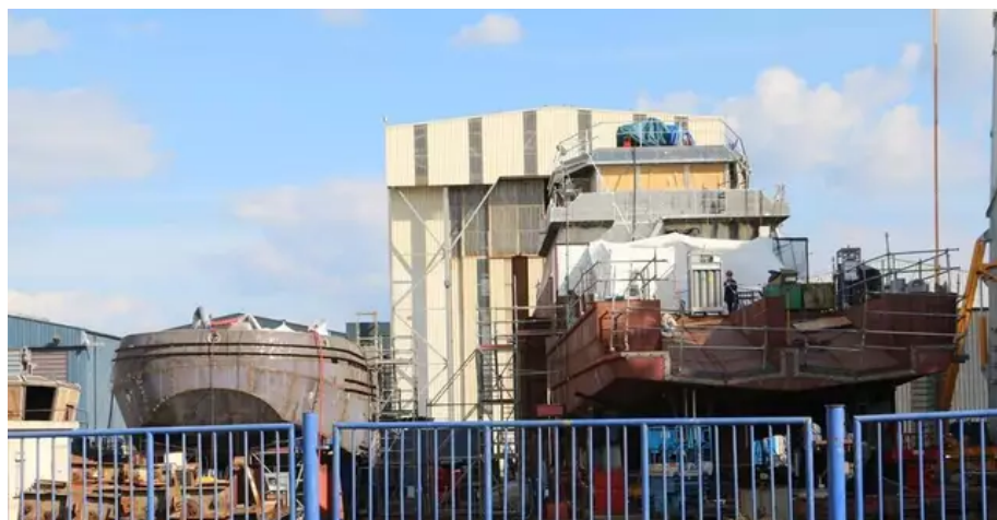
À la sortie du hangar des chantiers Piriou, le premier des trois patrouilleurs (à droite) commandé par le Sénégal et le premier des vingt remorqueurs à destination de la Marine nationale.

À ses côtés, le premier des vingt remorqueurs commandés par la Marine nationale . Ces derniers seront affectés aux bases navales de Brest, Cherbourg, Toulon, Fort-de-France (Martinique) et Papeete (Polynésie française) et auront pour mission de prendre en charge et d'assister les navires de surface et les sous-marins, notamment lors des manœuvres d'accostage. Si la fin du « programme sénégalais » est prévue à l'été 2024, les remorqueurs seront livrés, à raison de quatre unités par an, à partir de l'été 2022.