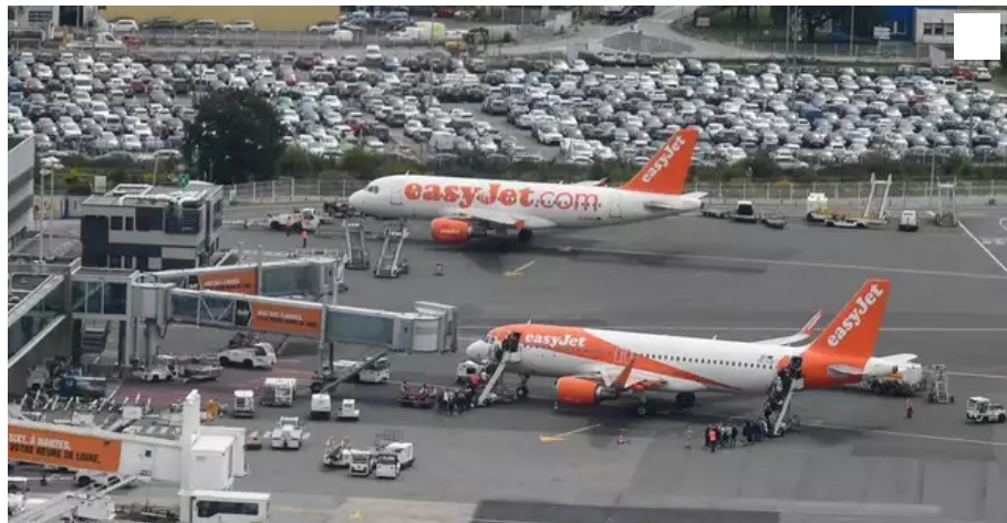
Ce sont les engins au sol qui seront alimentés à l'hydrogène par Vinci.

Le groupe Vinci, qui exploite 45 aéroports dans le monde, va produire de l'hydrogène près de Lyon Saint-Exupéry pour tester son usage dans les engins au sol et les poids lourds du secteur. Avant que les avions s'y mettent à leur tour.