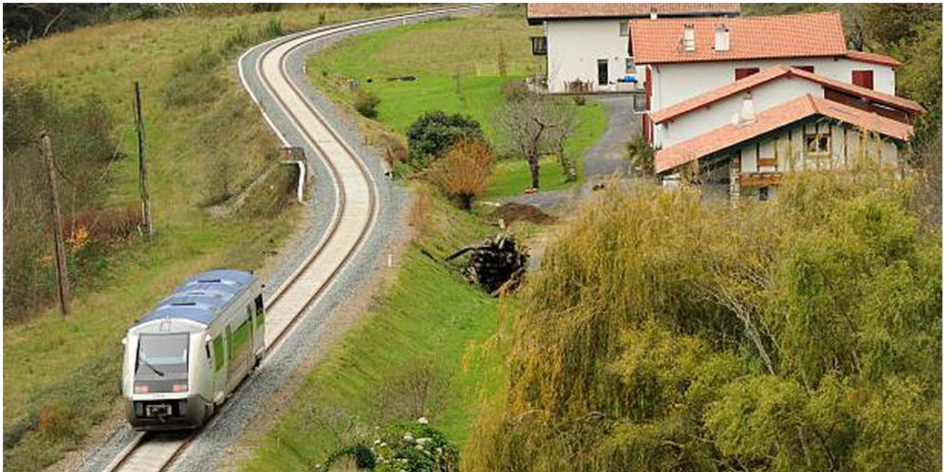
La société Railcoop attend que la SNCF lui libère des sillons pour pouvoir lancer son Bordeaux-Lyon dès juin prochain.

Par Sudouest.fr avec AFP Publié le 08/10/2021 à 7h32