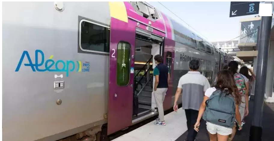
L'ouverture à la concurrence de la circulation des TER est en marche.

Nouvelle étape dans le processus d'ouverture du TER à la concurrence en Pays de la Loire. Le conseil régional a voté hier le lancement du premier appel d'offres à des entreprises privées. Une démarche toujours très contestée à gauche.