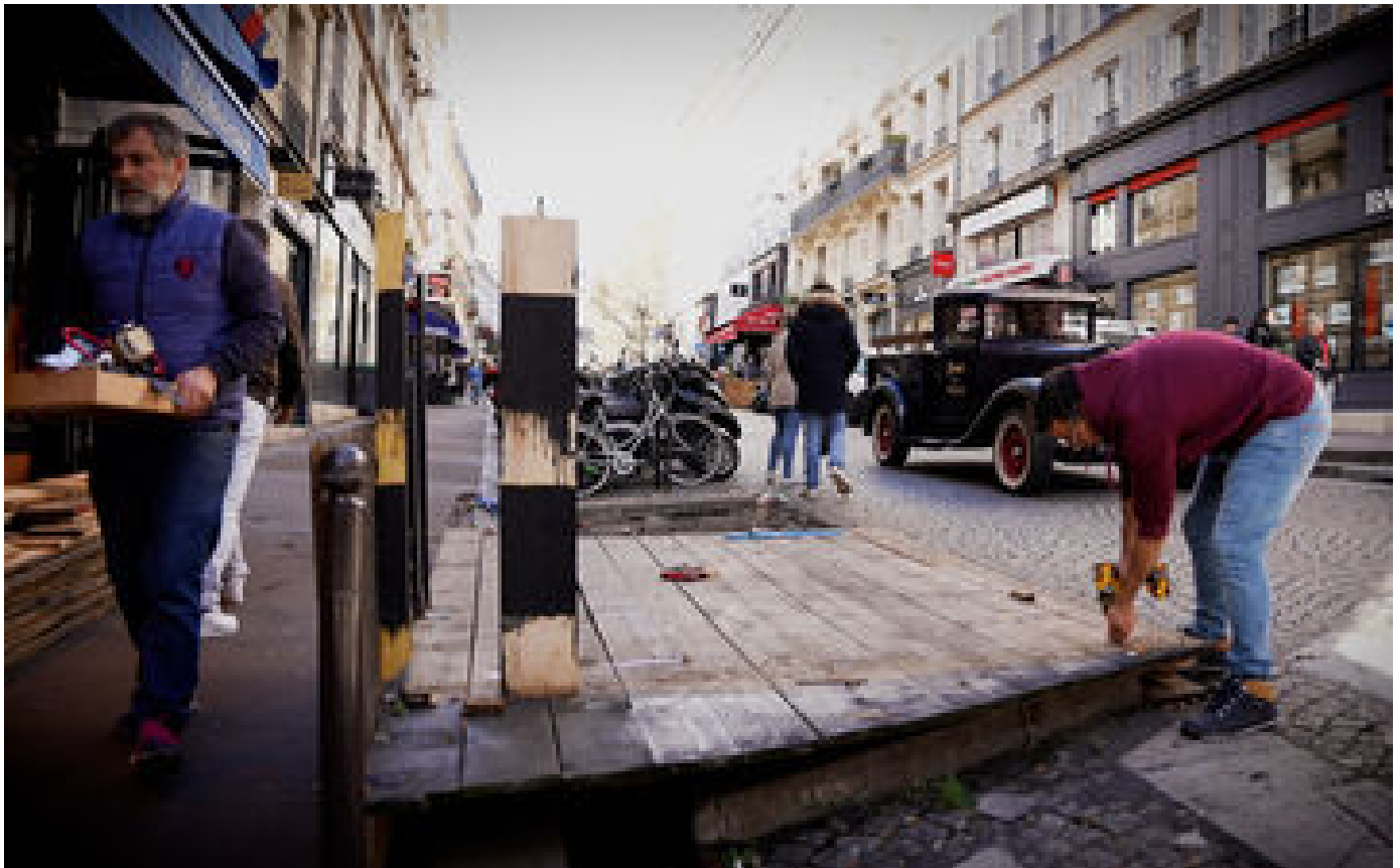
VIDÉO. Fin des terrasses éphémères à Paris : «On perd des places mais c'est quand même plus propre»