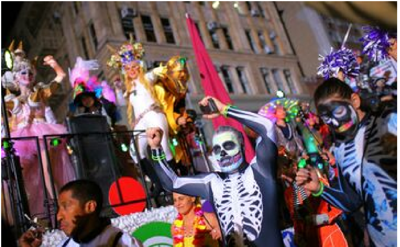
VIDÉO. «C'est comme une famille qui se retrouve» : la parade d'Halloween de New York enfin de retour