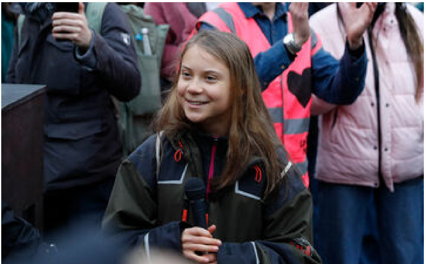
VIDÉO. «Nous allons faire le changement, qu'ils le veulent ou non !», lance Greta Thunberg en marge de la COP26