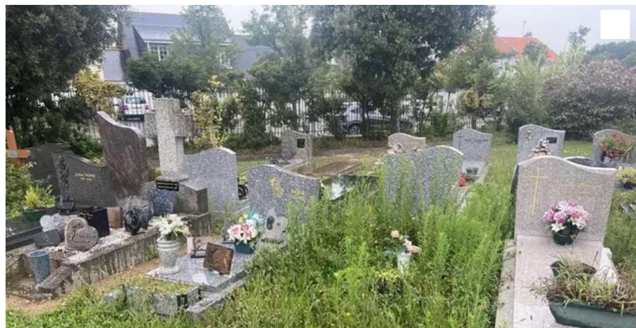
Le « Zéro-phyto » laisse entrer la nature dans les cimetières.

Un lecteur de Castres nous écrit son désarroi devant le manque d'entretien du cimetière Miséricorde, à Nantes, et la réponse que lui a apportée la maire de Nantes.